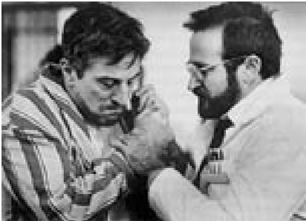
Fra filmen Oppvåkningen

Boken viser hvordan medisins vekst og fall avspeiler seg gjennom spillefilmer i siste halvdel av det 20. århundret. Her er mange spennende historier, men på bakgrunn av de store forventningene som tittelen skaper, blir det hele likevel litt skuffende. Det skyldes dels den særdeles amerikanske innfallsvinkelen og dels den deskriptive og til tider litt kjedelige formen. Men du verden så mange detaljer og så mye informasjon for alle som er interessert i legerollens utvikling – både på og utenfor lerretet.